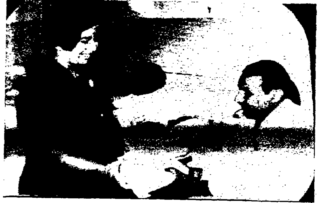
سوم الجمعة بسملة لوزج الهدايا على افرسي في المستشفيات . وهو مشهد من اعمال سوما الخيرية عرفة القنزون الارضي ببنفسه عيد ميلاده ٣٠ ١١

وعلى الرغم من أن لغة التدريس هي الانكليزية فإن الفلسطينيين سيلاون كل لرسمة تعلم اللغة العربية.